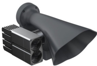
LP12 M30 Serien Lautsprecher mit Scheinwerfer