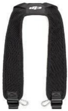
Tragegurt RC Plus Strap