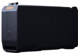
Intelligenter selbsterwärmender Akku TB30